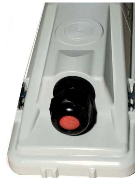
Pressacavo Ex e IIC Ex e IIC Cable gland