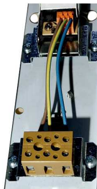
Morsetti Ex e IIC Ex e IIC Terminals